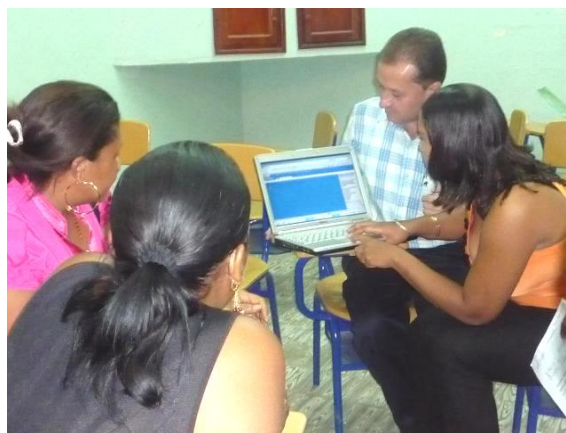
Gráfica 7. El facilitador alfabetizador orienta y acompaña a sus estudiantes en los usos apropiados de las TIC involucradas.

Se puede inferir que el facilitador demanda demostrar actitud, idoneidad, habilidades y destrezas para el rol que está llamado a representar. Se trata de una preparación y capacitación como paso previo para afrontar la enorme responsabilidad contribuir a la alfabetización de jóvenes y adultos con apoyo de TIC. Así las cosas, para ser un facilitador exitoso, el PAVA tuvo que diseñar y ejecutar un plan de alfabetización y capacitación de los facilitadores en competencias pedagógicas, técnicas y tecnológicas que lo habilitaron para ejercer mejor su rol.